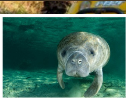
TABELA DE PREÇOS E PASSEIOS