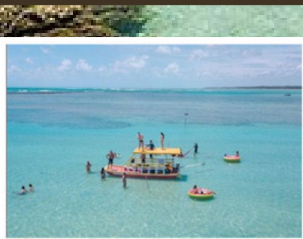
TABELA DE PREÇOS E PASSEIOS